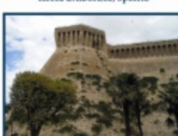
Rocca di Acquariva Picena (AP)