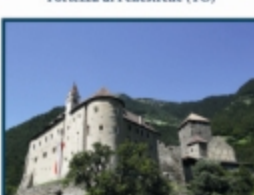
Castel Tirolo (BZ)