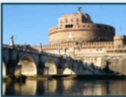
Castel Sant'Angelo, Roma