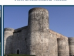
Castello Ursino, Catania

Visite a castelli, convegni, tavole rotonde, mostre, concerti, celebrazioni di restauri di edifici fortificati. Lo scopo dell'iniziativa è di avvicinare il pubblico a questo settore dell'architettura di enorme importanza per il nostro Paese