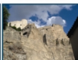
Castello di Santa Severina (CT)