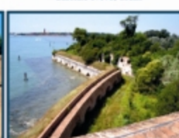
Forte di Sant'Andrea, Venezia