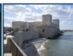
Castello svevo, Trani