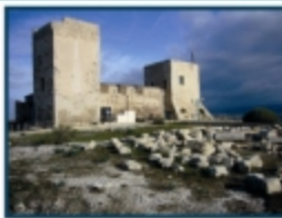
Castello di San Michele, Cagliari

SEGRETARIA GENERALE Via G.A. Borgese 14 - 20154 Milano martedì-martedì-giovedì 9.30-13.00 tel./fax 02.347237 segreteria.castelli@turismonoculturale.org www.castelli.it