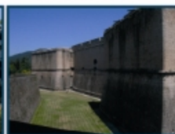
Castello de l'Aquila