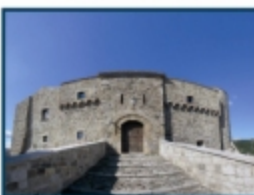
Castello di Civitavecchia (RM)