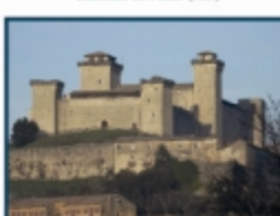
Rocca d'Albornoz, Spoleto