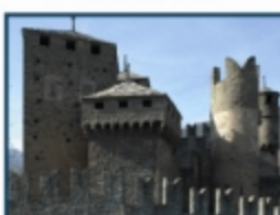
Castello di Fénis (AO)