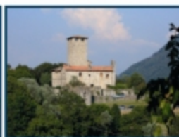
Castello di Bianzano (BG)