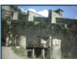
Fortezza di Fenestrelle (TO)