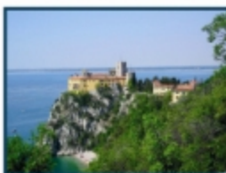
Castello di Duino (TS)