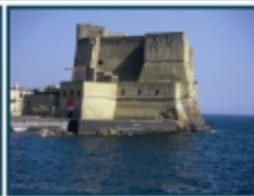
Castel dell'Ovo, Napoli