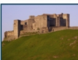
Castello di Meli (PZ)