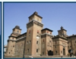
Castello Estense, Ferrara