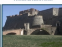
Fortezza del Priamar, Savona